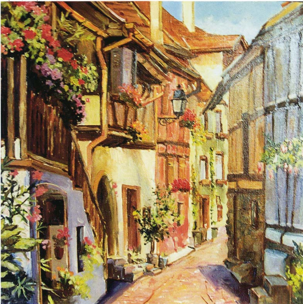
«Франция. Провинция. Эльзас», холст, масло, 45x45