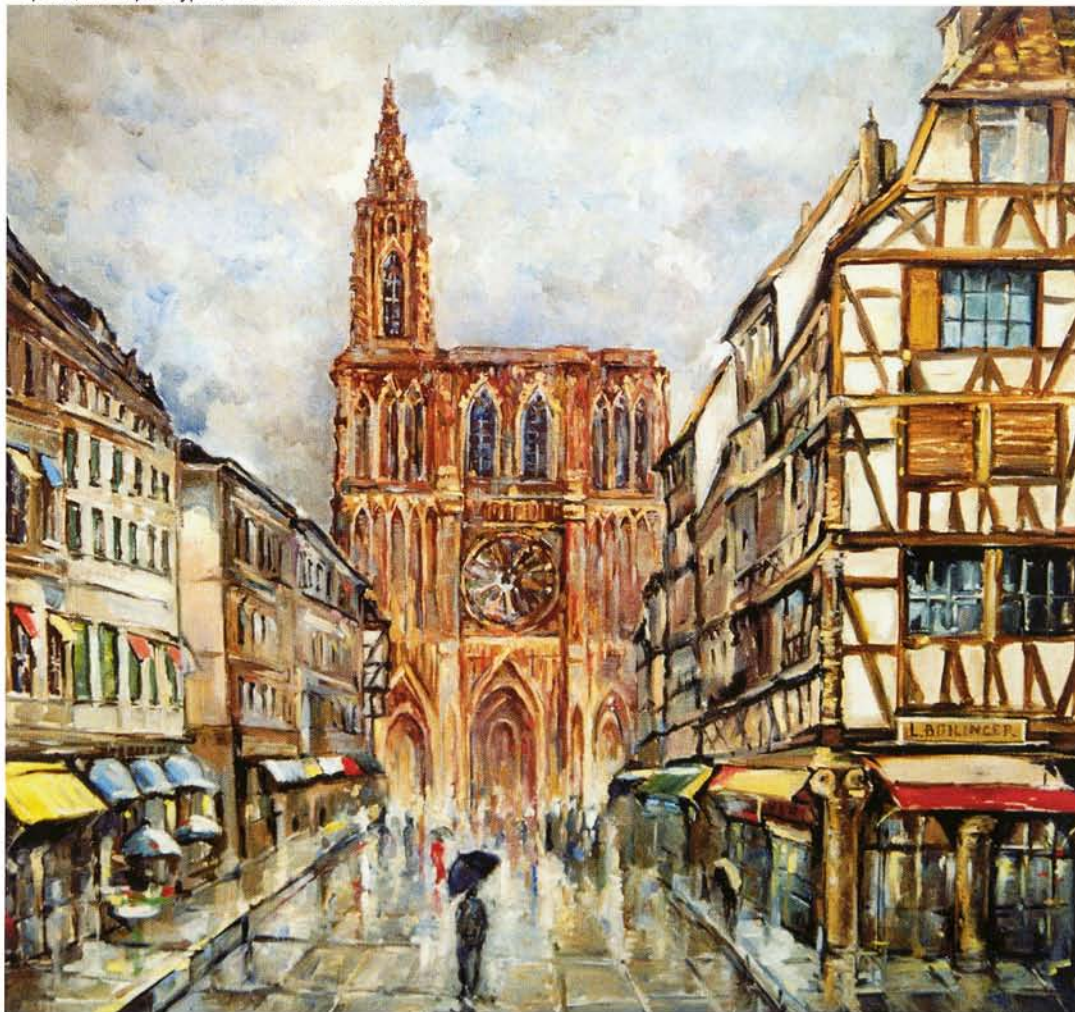
«Франция. Страсбург», холст, масло, 101x110