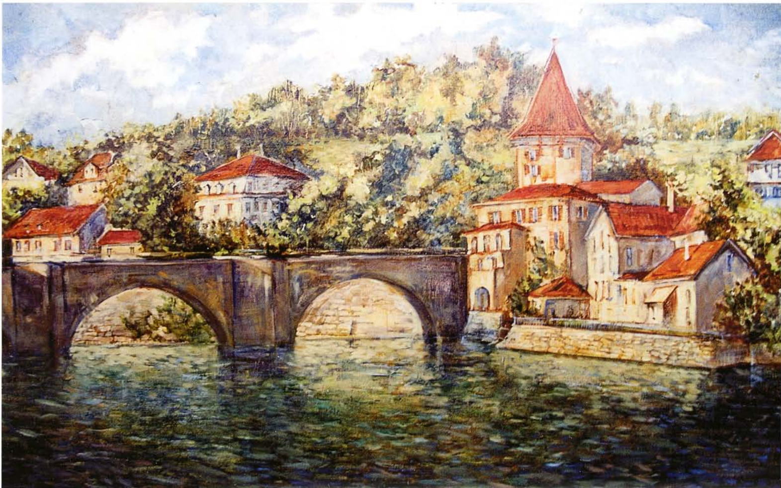
«Берн», холст, масло, 70x115